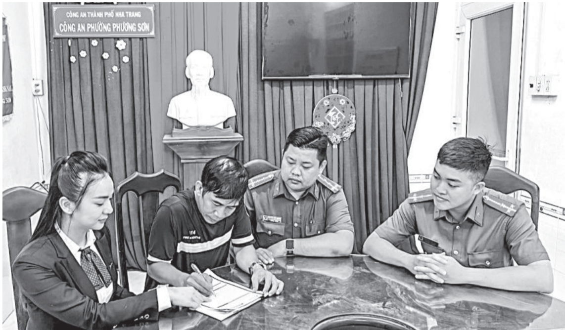
● Nhân viên Ngân hàng Sài Gòn Thương tín Chi nhánh Khánh Hòa phối hợp với Công an phường Phương Sơn (TP. Nha Trang) hướng dẫn người dân mở tài khoản cá nhân.

Việc thực hiện chi trả chế độ bảo hiểm xã hội (BHXH) qua tài khoản cá nhân không chỉ đem lại tiện ích cho người sử dụng mà còn giúp cơ quan quản lý, thực hiện chính sách BHXH giảm chi phí hành chính và nâng cao tính minh bạch trong tài chính.