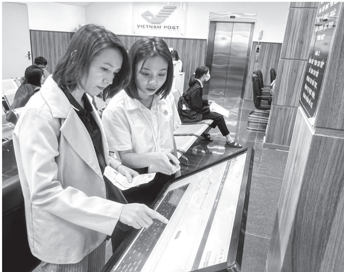
● Nhân viên Trung tâm Phục vụ hành chính công tỉnh hướng dẫn người dân tra cứu hồ sơ, thủ tục hành chính.

SIPAS 2023 của tỉnh chuyển biến tích cực với chỉ số 81,09%, đứng thứ 43/63 tỉnh, thành phố; tăng 4,38% và tăng 10