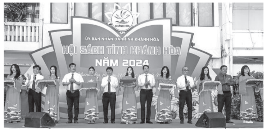
● Các đại biểu thực hiện nghi thức cắt băng khai mạc hội sách.