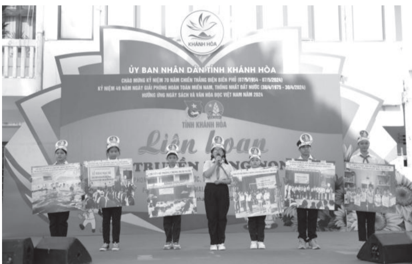
● Các đội tham gia liên hoan.

Chiều 22-4, tại Trường Đại học Khánh Hòa, Tỉnh đoàn - Hội đồng Đội tỉnh tổ chức Liên hoan các đội tuyên truyền măng non năm 2024 với chủ đề "Tuyên truyền bảo vệ trẻ em".