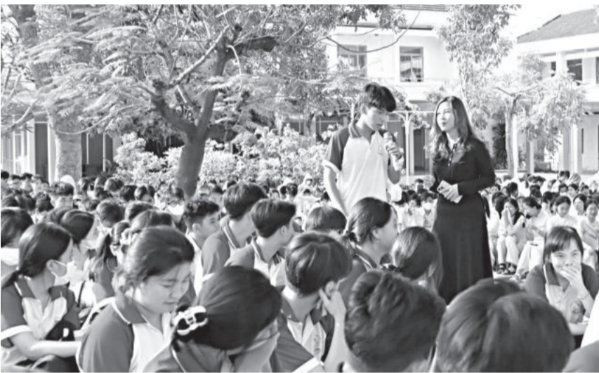
● Hỏi - đáp với học sinh về bệnh không lây nhiễm trong buổi truyền thông tại Trường THPT Phan Bội Châu (TP. Cam Ranh).

Ngày 22-4, Trung tâm Kiểm soát bệnh tật tỉnh phối hợp với Sở Giáo dục và Đào tạo, Bệnh viện Chuyên khoa Tâm thần tỉnh tổ chức truyền thông phòng, chống bệnh không lây nhiễm và phòng, chống tác hại của rượu, bia trong trường học cho hơn 420 học sinh Trường THPT Lạc Long Quân (huyện Khánh Vĩnh).