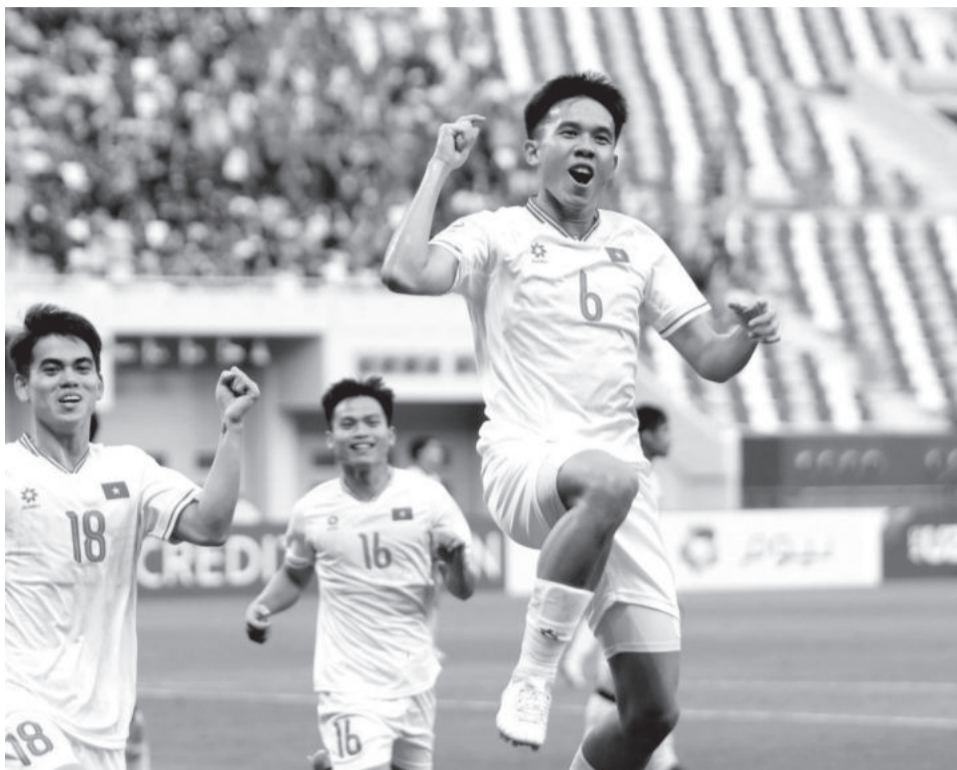
● Niềm vui của các cầu thủ U23 Việt Nam sau chiến thắng Malaysia.

Hiện tại, cả U23 Việt Nam và U23 Uzbekistan đều rất hưng phấn sau 2 trận toàn thắng. Tuy vậy, nếu xét về thực lực và những gì 2 đội thể hiện có thể thấy, U23 Uzbekistan được đánh