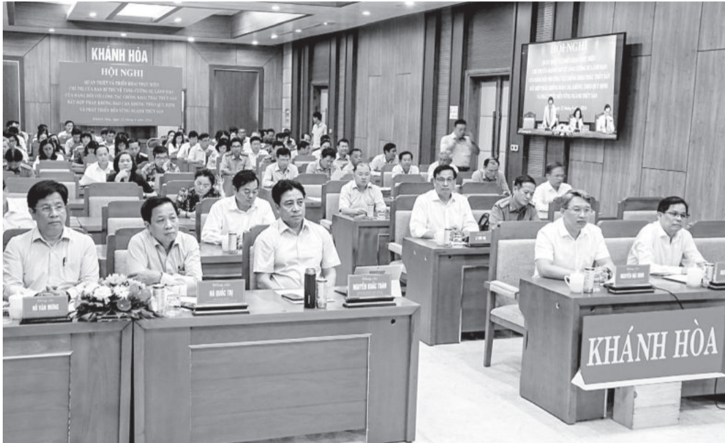
● Các đồng chí Thường trực Tỉnh ủy và đại biểu dự hội nghị tại điểm cầu Khánh Hòa.