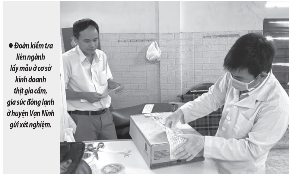
● Đoàn kiểm tra liên ngành lấy mẫu ở cơ sở kinh doanh thịt gia cầm, gia súc đông lạnh ở huyện Vạn Ninh gửi xét nghiệm.

Ngày 22-4, đoàn công tác của Ban Chỉ đạo (BCĐ) liên ngành Trung ương về an toàn thực phẩm (ATTP) do bà Trần Việt Nga - Phó Cục trưởng Cục ATTP (Bộ Y tế) làm trưởng đoàn có buổi làm việc với BCĐ liên ngành vệ sinh ATTP tỉnh về kết quả công tác quản lý nhà nước về ATTP và triển khai thực hiện Tháng hành động vì ATTP năm 2024 trên địa bàn tỉnh.