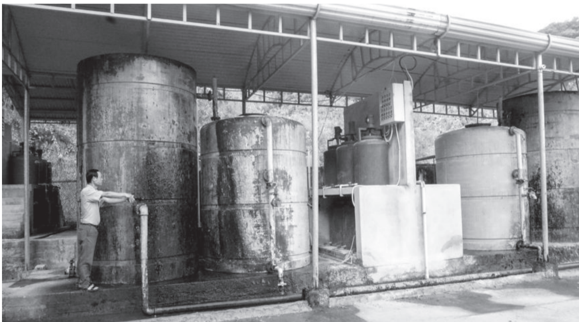
● Hệ thống cấp nước sinh hoạt Sơn Hiệp được đề xuất đầu tư để nâng cấp thành công trình cấp nước sạch.