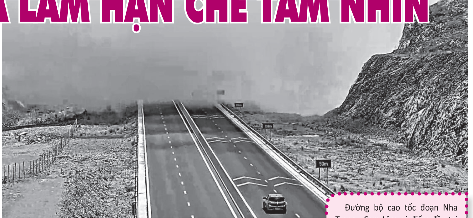
● Các mỏ đá nổ mìn làm bụi bay mù mịt trên đường bộ cao tốc đoạn Nha Trang - Cam Lâm.