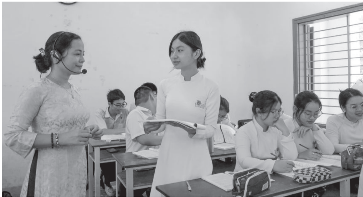
● Tiết ôn tập của học sinh Trường THPT Lý Tự Trọng.

Hơn 2 tháng nữa sẽ diễn ra kỳ thi tốt nghiệp THPT năm 2024 (ngày 27 và 28-6). Đây là thời điểm các trường vừa tập trung dạy học, chuẩn bị kiểm tra cuối học kỳ II để hoàn thành chương trình theo kế hoạch, vừa tăng tiết ôn tập, củng cố kiến thức cho học sinh (HS).