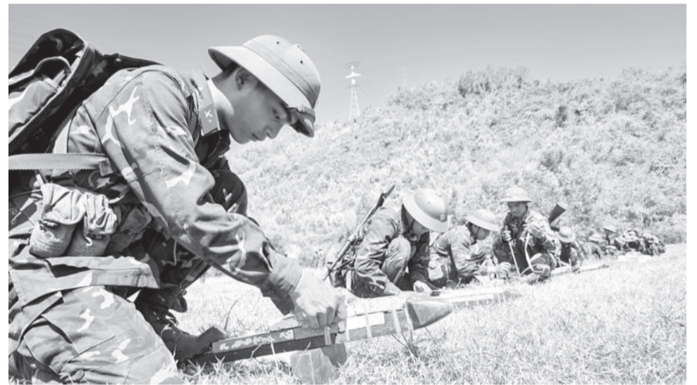
● Các chiến sĩ mới huấn luyện nội dung gói buộc lựu nổ.

Trong quá trình huấn luyện trên thao trường, để khắc phục khó khăn, nhất là về điều kiện thời tiết nắng nóng khắc nghiệt gây ảnh hưởng không nhỏ đến thể lực của cán bộ, chiến sĩ, đơn vị không tổ chức huấn luyện thể lực