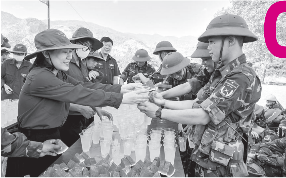
● Đoàn viên, thanh niên xã Diên Thọ, huyện Diên Khánh tổ chức hoạt động "Tiếp sức mùa huấn luyện" tại tiểu đoàn.