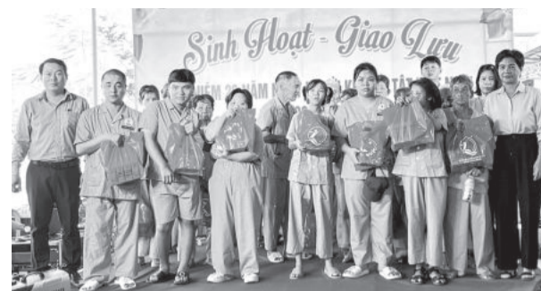
● Lãnh đạo Trung tâm Bảo trợ xã hội và Công tác xã hội tỉnh tặng quà cho người khuyết tật.

Chiều 17-4, tại cơ sở 2 thị xã Ninh Hòa, Trung tâm Bảo trợ xã hội và Công tác xã hội tỉnh tổ chức buổi sinh hoạt, giao lưu kỷ niệm ngày Người Khuyết tật Việt Nam (18-4-1998 - 18-4-2024).