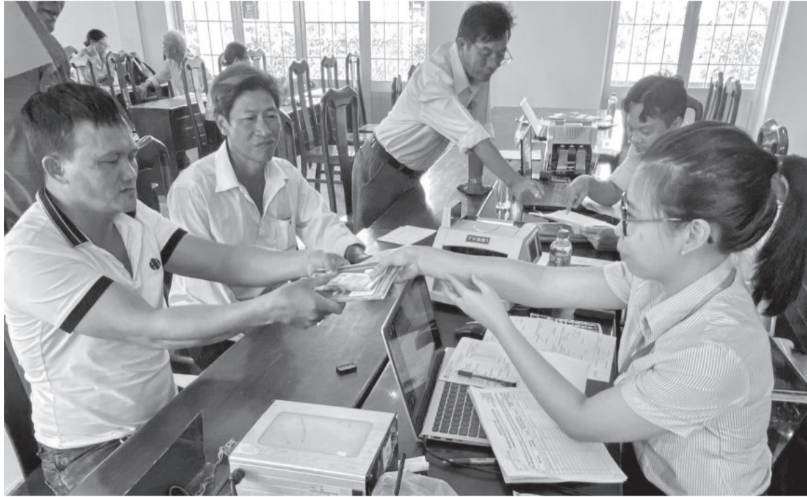
● Một phiên giao dịch tại xã Ninh Lộc, thị xã Ninh Hòa.

Thực hiện chỉ tiêu kế hoạch tín dụng năm 2024, Ngân hàng Chính sách xã hội (NHCSXH) tỉnh đã tham mưu Ban đại diện Hội đồng quản trị NHCSXH tỉnh giao chỉ tiêu cho các huyện, thị xã, thành phố để giải ngân kịp thời, đáp ứng nhu cầu vay vốn của hộ nghèo và các đối tượng chính sách khác.