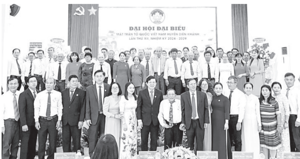
● Các ủy viên UBMTTQ Việt Nam huyện nhiệm kỳ mới chụp ảnh kỷ niệm với các đại biểu.

Nhiệm kỳ qua, Mặt trận và tổ chức thành viên huyện Diên Khánh đã đa dạng hóa các hình thức tập hợp, đoàn kết rộng rãi các giai cấp, tầng lớp nhân dân thực hiện tốt chủ trương, đường lối của Đảng, chính sách pháp luật của Nhà nước, chương trình phát triển kinh tế - xã hội của địa phương; mở rộng khối đại đoàn kết toàn dân tộc, tăng cường sự đồng thuận xã hội. Công tác triển khai thực hiện các phong trào thi đua yêu nước, cuộc vận động luôn được quan tâm, thu hút đông đảo các tầng lớp nhân dân tham