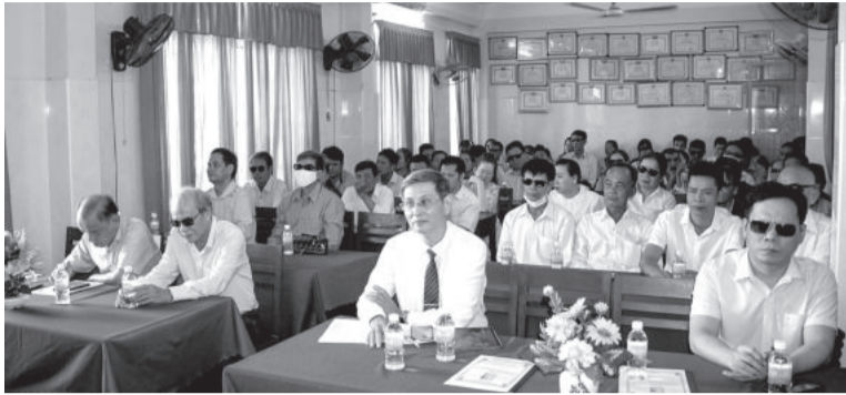
● Quang cảnh tại lễ kỷ niệm.

Ngày 17-4, Hội Người mù tỉnh tổ chức lễ kỷ niệm 55 năm Ngày thành lập Hội Người mù Việt Nam (17-4-1969 - 17-4-2024) và 26 năm Ngày Người Khuyết tật Việt Nam (18-4-1998 - 18-4-2024).