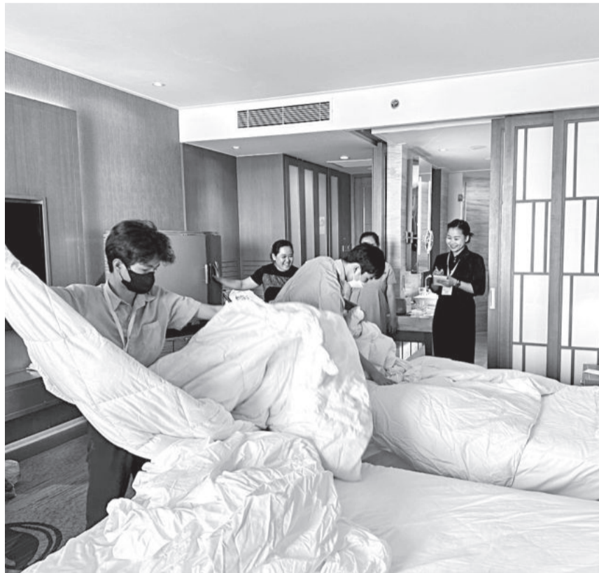
● Học sinh của trung tâm thực hành làm buồng phòng khách sạn.

Được biết, năm 2022, với sự hỗ trợ của Hội Những người ái mộ bác sĩ A.Yersin tỉnh, mạnh thường quân, có 12 HS khiếm thính của trung tâm được học khóa đào tạo tại các khách sạn về cách thức xếp bàn ăn Âu, Á, cách đi đứng phục