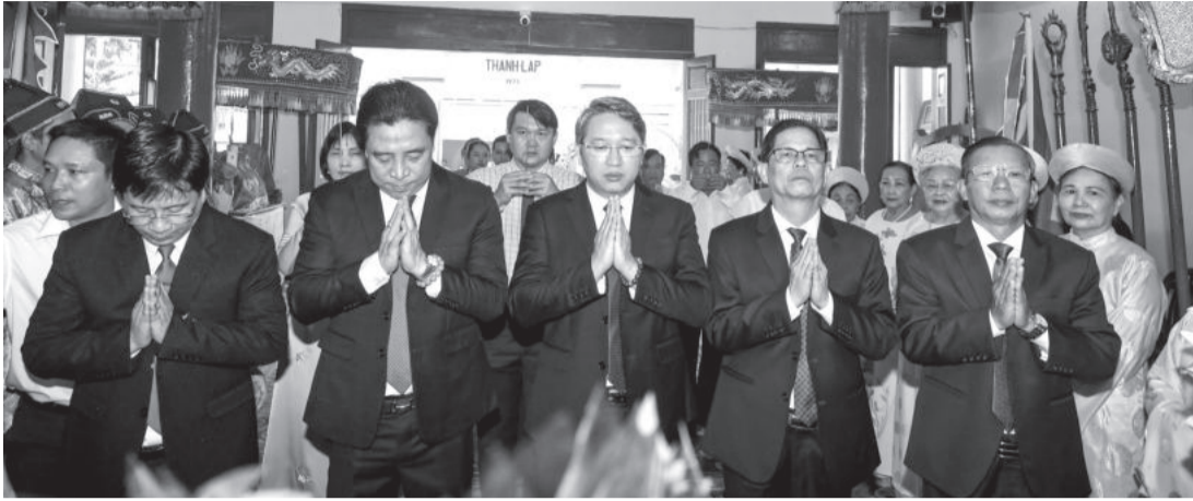
● Các đồng chí lãnh đạo tỉnh dâng hương tưởng nhớ các vua Hùng.