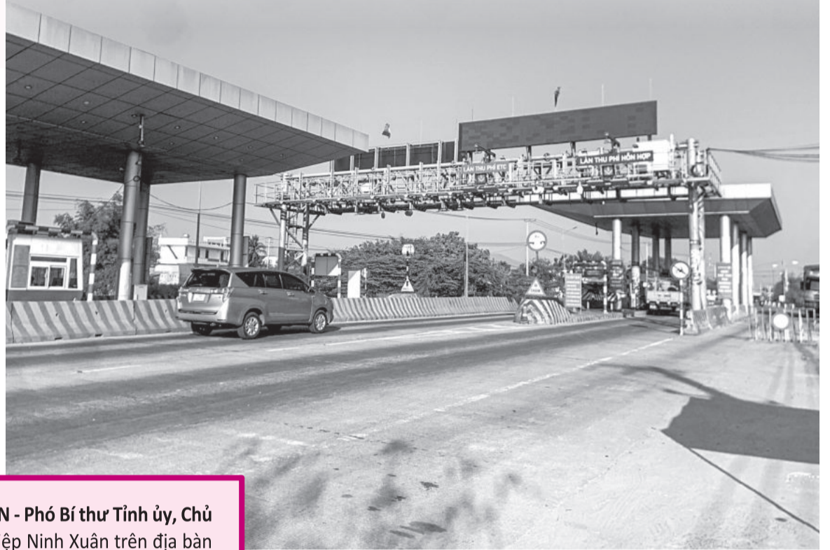
● Trạm thu phí BOT Ninh Xuân trên Quốc lộ 26.

thu thực tế của 2 trạm thu phí trên Quốc lộ 26 năm 2019 chỉ đạt 2,62% so với phương án tài chính; năm 2020 đạt 46,55%; năm 2021 đạt 54,56%; năm 2022 đạt 79,41%; năm 2023 đạt 69,68%.