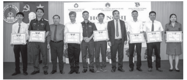
● Các tập thể nhận giấy khen của Sở Lao động - Thương binh và Xã hội.

Những năm qua, các đơn vị đã phối hợp chặt chẽ đẩy mạnh công tác tuyên truyền, tư vấn; qua đó đã có 2.332 thanh niên hoàn thành nghĩa vụ quân sự, công an được hỗ trợ đào tạo nghề theo nguyện vọng. Trong đó, có 1.088 thanh niên được hỗ trợ từ nguồn ngân sách tỉnh; 1.244 thanh niên được hỗ trợ từ nguồn kinh phí của Bộ Quốc phòng. Sau đào tạo, 100% thanh niên đều có việc làm hoặc tự tạo việc làm ổn định cuộc sống. Bên cạnh đó, mỗi năm, Trung tâm Dịch vụ việc làm tỉnh đã tổ chức 134 phiên giao dịch việc làm nhằm hỗ trợ, kết nối việc làm cho thanh niên. Chỉ tính riêng trong năm 2023, đơn vị