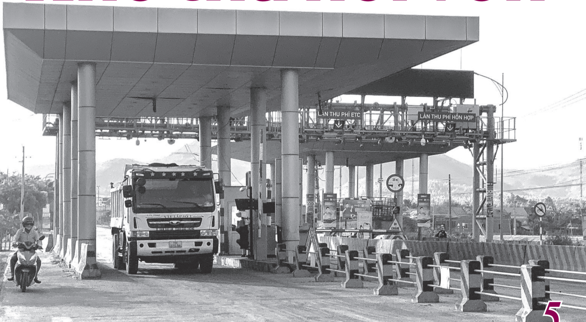
● Trạm thu phí BOT Ninh Xuân trên Quốc lộ 26.