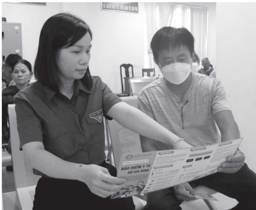
● Cán bộ Bảo hiểm xã hội tỉnh (bên trái) tuyên truyền chính sách bảo hiểm y tế hộ gia đình cho người dân.

UBND tỉnh căn cứ vào chương trình hành động, chỉ thị của Tỉnh ủy và Nghị quyết của HĐND tỉnh đã ban hành hệ thống văn bản để tổ chức thực hiện nhiệm vụ về BHXH, BHTN, BHYT trên địa bàn tỉnh như: Giao chỉ tiêu BHXH, BHTN, BHYT ở cấp tỉnh, cấp huyện, cấp xã và giao đến từng thôn, tổ dân phố; chỉ đạo Tổ công