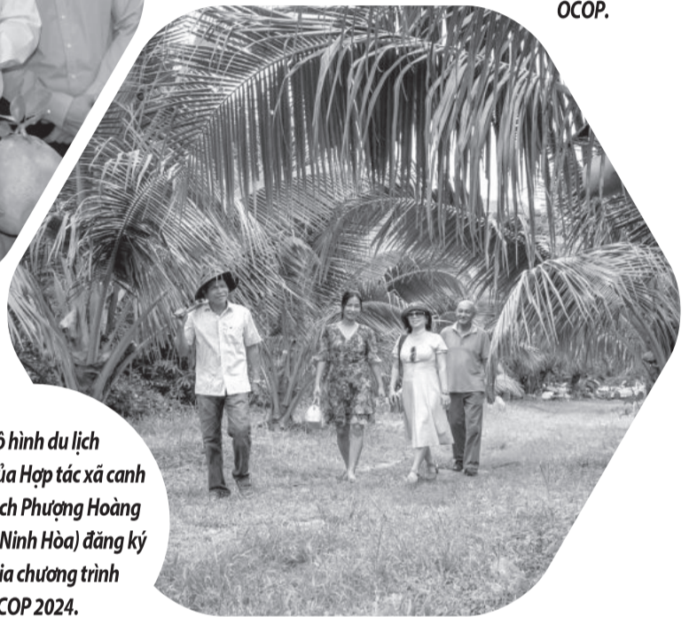
● Mô hình du lịch sinh thái của Hợp tác xã canh nông du lịch Phương Hoàng (Ninh Tây, Ninh Hòa) đăng ký tham gia chương trình OCOP 2024.