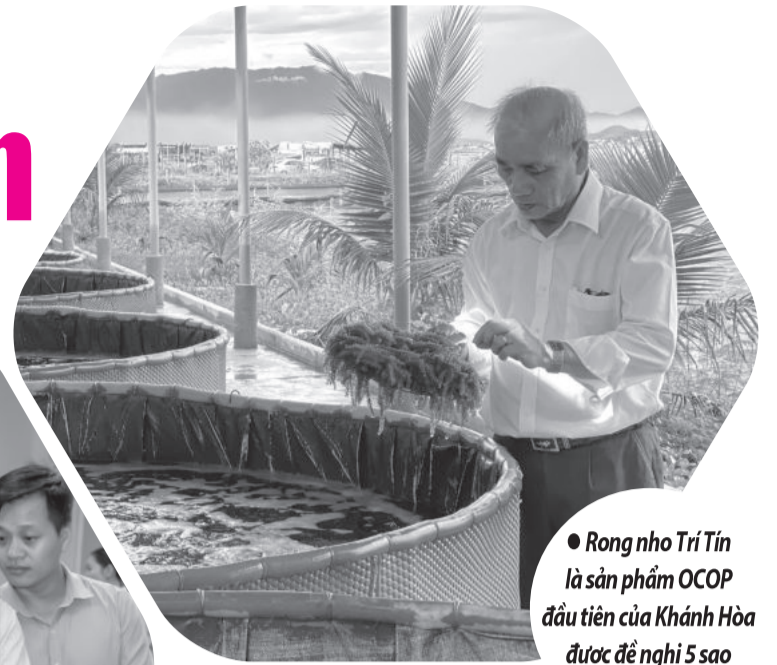
● Rong nho Trí Tín là sản phẩm OCOP đầu tiên của Khánh Hòa được đề nghị 5 sao OCOP.