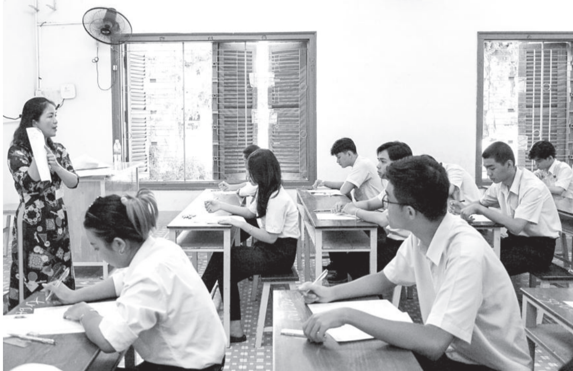
● Thí sinh tham dự kỳ thi tốt nghiệp THPT năm 2023.

Đợt tuyển sinh đại học năm 2024 cơ bản giữ ổn định như năm 2023, đồng thời dự kiến sẽ có một số thay đổi về mặt kỹ thuật để tạo thuận lợi cho thí sinh (TS). Mới đây, Sở Giáo dục và Đào tạo (GD-ĐT) đã ban hành kế hoạch triển khai công tác này đến các trường.