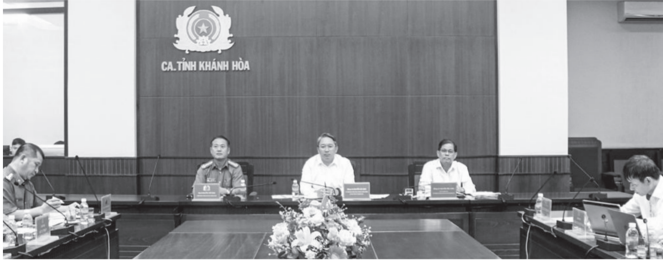
● Các đồng chí lãnh đạo tỉnh tham dự phiên họp tại điểm cầu Khánh Hòa.