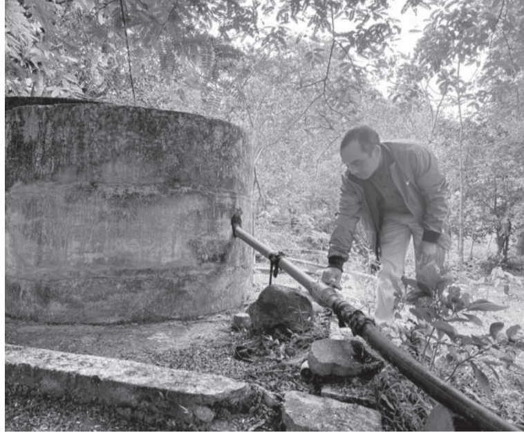
● Hệ thống cấp nước cho đồng bào dân tộc Raglai ở xóm Suối Rua (thôn Sông Cạn Tây, xã Cam Thịnh Tây, TP. Cam Ranh) xuống cấp trầm trọng.

Ông NGUYỄN NGỌC SƠN - Phó Trưởng ban Dân tộc tỉnh: Tỉnh nên có chính sách riêng đối với việc đầu tư công trình cấp nước cho khu vực miền núi và vùng ĐBDTTS vì ở đây dân cư thưa thớt, nhu cầu sử dụng nước ít. Những hệ thống không thể sử dụng được thì nên sớm thanh lý để đầu tư lại. Khi xây dựng giá nước phải đảm bảo tính đúng, tính đủ, có chính sách miễn giảm cho hộ nghèo, hộ cận nghèo; các hộ dân còn lại phải đóng đủ theo quy định.