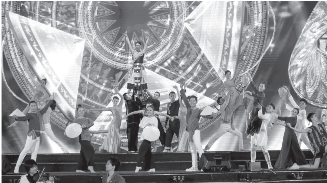
● Một chương trình ca nhạc tại Nha Trang có sự tham gia biểu diễn của các ca sĩ nổi tiếng.

Phát triển công nghiệp văn hóa được xem là một trong những giải pháp đột phá để phát triển văn hóa nói riêng, kinh tế - xã hội đất nước nói chung. Thời gian qua, tỉnh đã có những dấu hiệu tích cực trong việc tạo dựng nên những sản phẩm văn hóa đáp ứng nhu cầu thị trường.