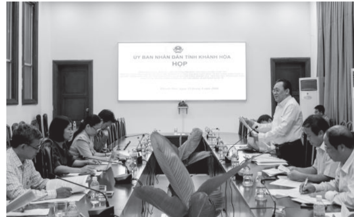
● Quang cảnh cuộc họp.