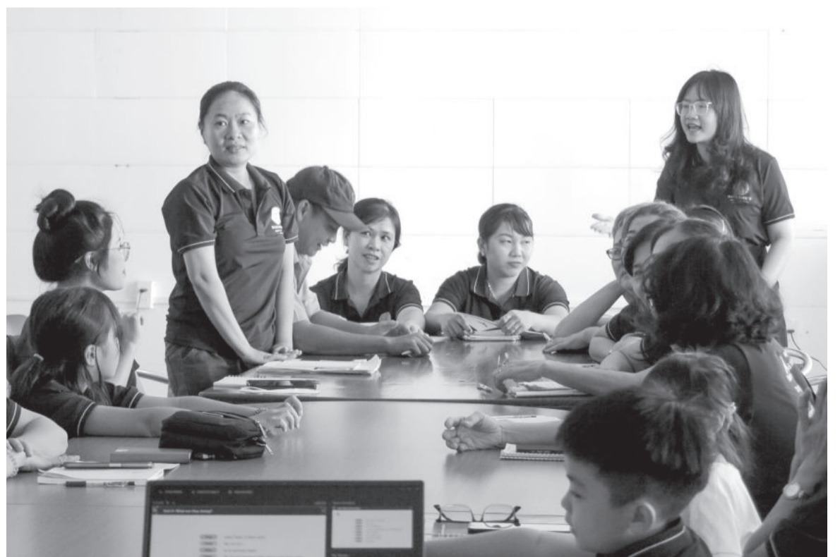
● Một buổi sinh hoạt của câu lạc bộ tiếng Anh chợ Đầm.