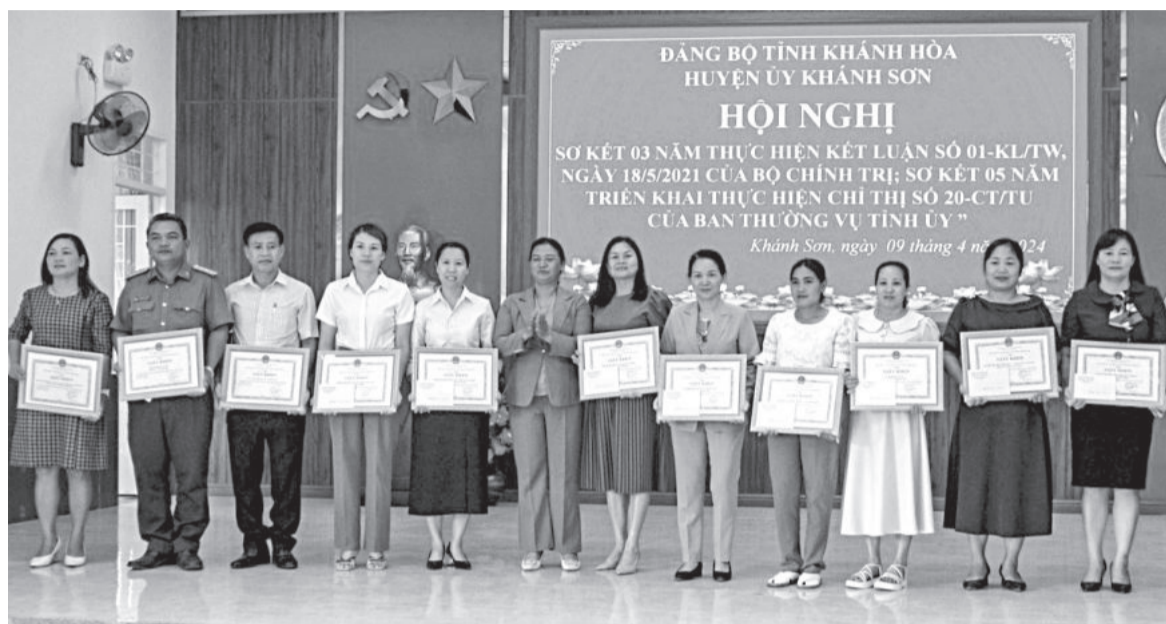
● Các tập thể đạt thành tích xuất sắc trong học tập và làm theo Bác được nhận giấy khen.

luận số 01 của Bộ Chính trị, Ban Thường vụ Huyện ủy Khánh Sơn đã chỉ đạo sâu sát việc đẩy mạnh xây dựng và nhân rộng các mô hình hay, cách làm hiệu quả gắn với thực tiễn của địa phương, sát với nhiệm vụ của mỗi địa phương, đơn vị, cá nhân. Trên cơ sở đó, nhiều đơn vị, địa phương đã căn cứ vào tình hình, điều kiện thực tế để lựa chọn và tiếp tục duy trì những mô hình, cách làm hiệu quả, như: Đoàn Thanh niên huyện với phong trào "Mỗi ngày một tin tốt, mỗi tuần một câu chuyện đẹp"; Hội Liên hiệp Phụ nữ huyện với phong trào "Ngày tiết kiệm vì phụ nữ nghèo", "Nuôi heo đất tiết kiệm", "Hũ gạo tình thương"; các địa phương trong huyện chú trọng nhân rộng các mô hình làm kinh tế giỏi, hướng dẫn người dân lựa chọn loại cây trồng, vật nuôi thích hợp có giá trị kinh tế cao; Hội Nông dân huyện triển khai phong trào thi đua nông dân sản xuất, kinh doanh giỏi, đoàn kết giúp nhau làm giàu và giảm nghèo bền vững... Qua thực hiện Kết