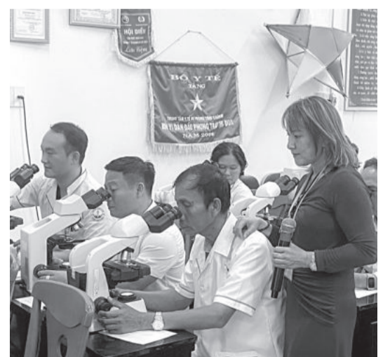
● Các học viên thực hành soi lam dưới kính hiển vi.

Tại lớp tập huấn, các học viên được cập nhật lại kiến thức tổng quan về bệnh sốt rét, triệu chứng lâm sàng, chẩn đoán và quản lý trường hợp bệnh sốt rét; chu kỳ ký sinh trùng sốt rét, mối liên quan giữa vòng đời ký sinh trùng sốt rét đến các biểu hiện lâm sàng của ca bệnh; hình thể các ký sinh trùng sốt rét; kỹ thuật nhuộm lam máu bằng giemsa... Sau lý thuyết, các học viên được thực hành soi lam tìm ký sinh trùng sốt rét; được hướng dẫn sử dụng test nhanh và thực hành sử dụng test nhanh.