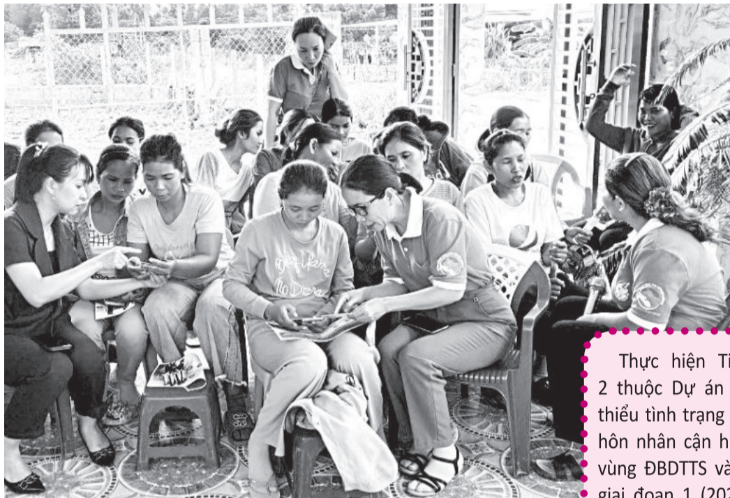
• Các buổi tuyên truyền được thực hiện thường xuyên, lồng ghép với các hoạt động khác.

Những năm qua, cùng với địa phương, các cấp hội phụ nữ trên địa bàn TP. Cam Ranh đã thực hiện nhiều hoạt động tuyên truyền, phổ biến giáo dục pháp luật, góp phần giảm thiểu tình trạng tảo hôn và hôn nhân cận huyết thống ở vùng đồng bào dân tộc thiểu số (ĐBDTTS).