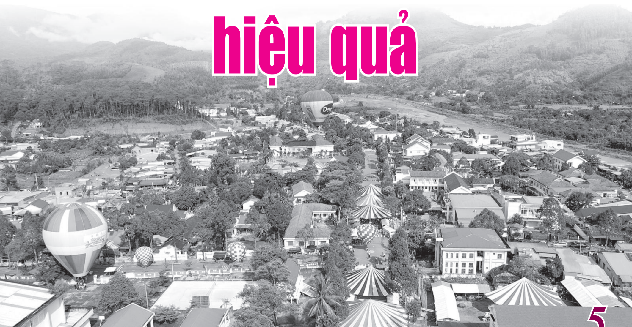
● Một góc thị trấn Tô Hạp.