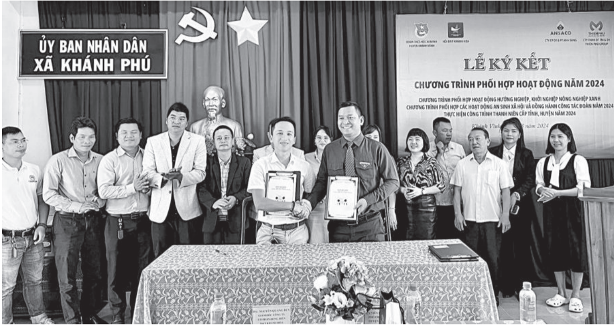
● Huyện đoàn Khánh Vĩnh ký kết phối hợp hoạt động trong năm 2024 với các doanh nghiệp.

Thời gian qua, việc phối hợp, vận động các nguồn lực xã hội cùng tham gia công tác đoàn đã trở thành giải pháp hữu hiệu cho bài toán kinh phí hoạt động của các tổ chức đoàn. Qua việc thực hiện tốt công tác xã hội hóa, các công trình thanh niên của đoàn đã trở nên thiết thực, hiệu quả hơn.